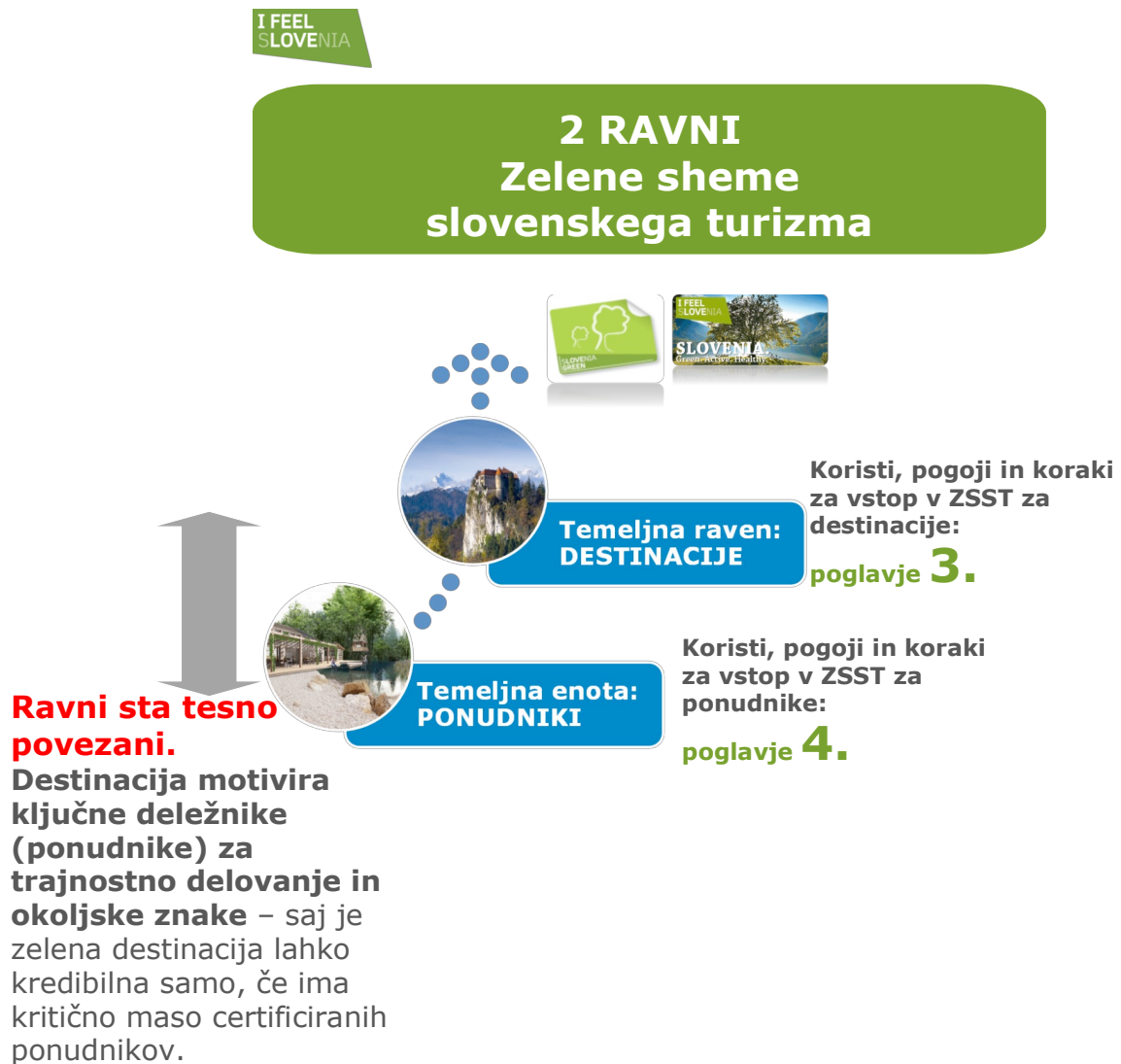
Shema št. 1: Prikaz dveh ravni delovanja ZSST